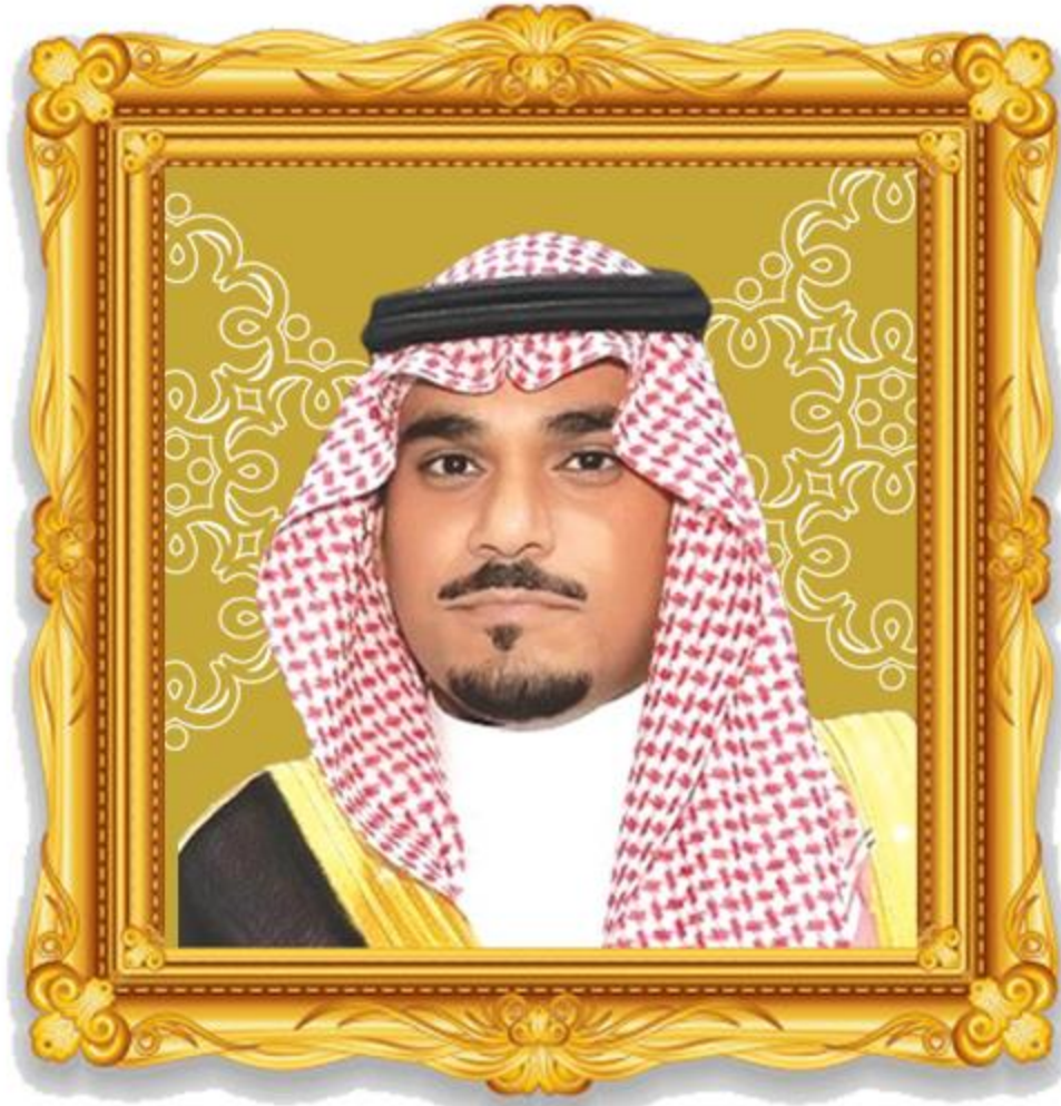
صَاحِبِ السَّمَوِ الْمَلِكِيِّ الْأَمِيرِ