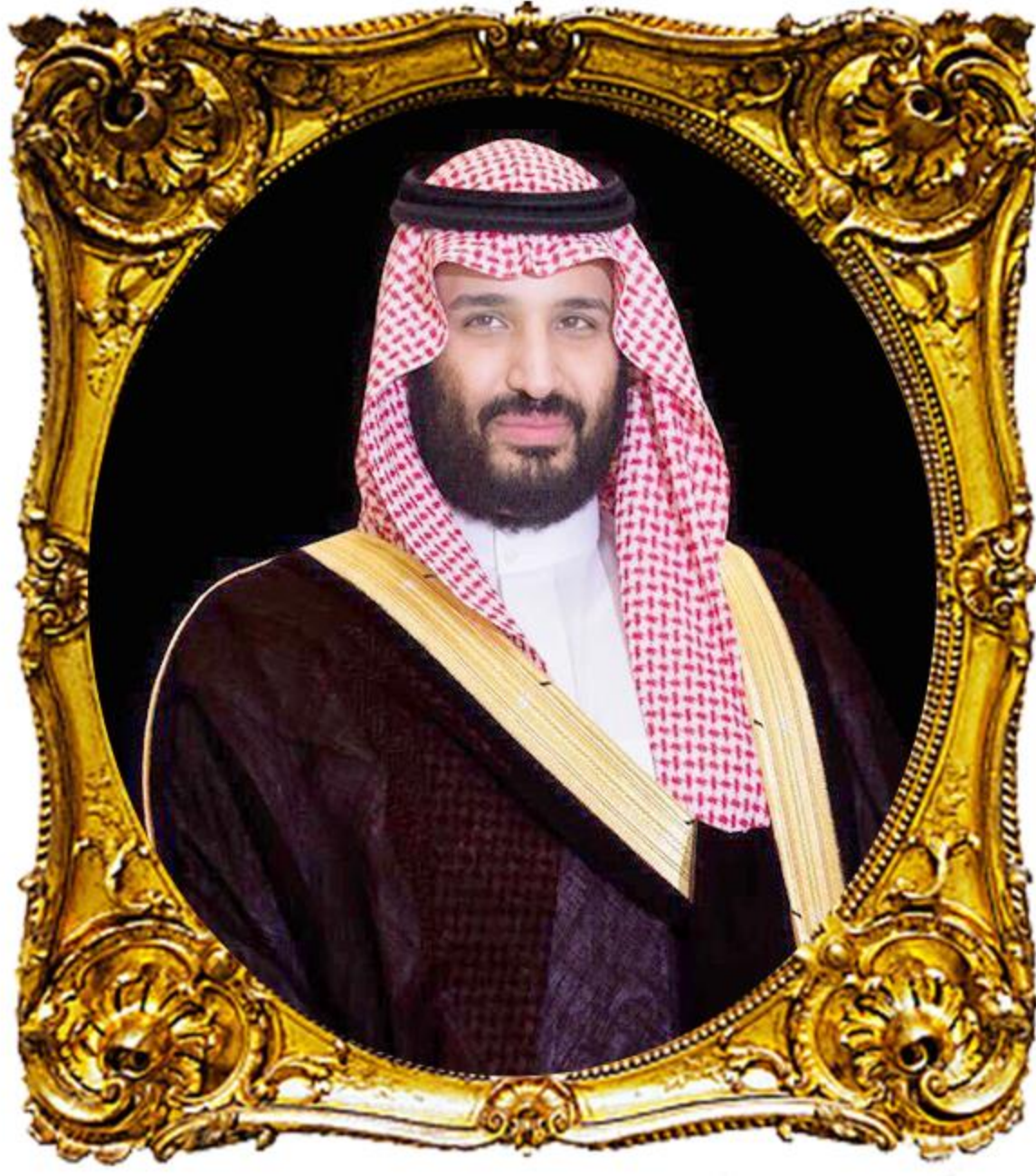
وَلِيِّ الْعَهْدِ صَاحِبِ السَّمَوِ الْمَلِكِيِّ الْأَمِيرِ