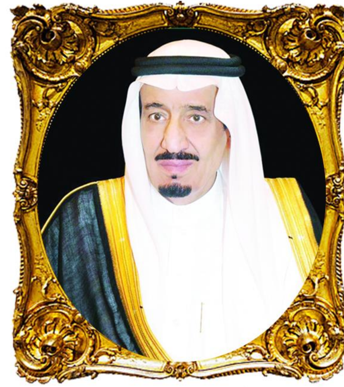
فَاحِمَ الدَّرَمِيِّينَ الشَّرِيفِيِّينَ الْمَلِكِ