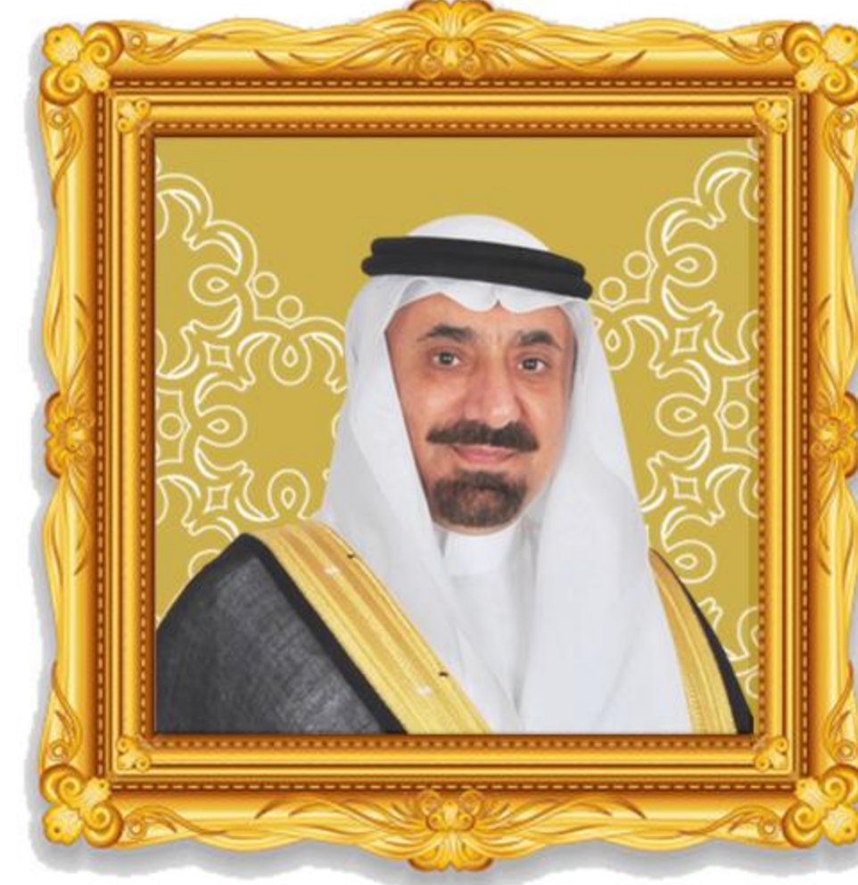
صَاحِبِ السَّمَوِ الْأَمِيرِ